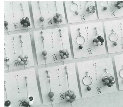
ビーズで作ったピアスとイヤリング