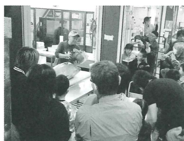
昨年の市場フェスタの様子