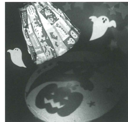
ハロウィントリックライト