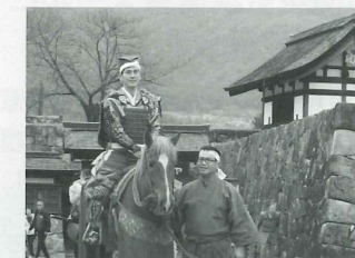
松代藩真田十万石行列