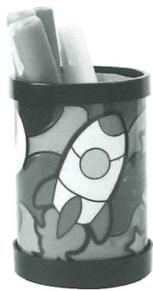
ステンドグラスカップ

とき 10/27(日) 11:00～11:30、14:00～14:30、15:30～16:00 ところ ハピリン5階エレベーター前 内容 12種類のカラーフィルムを自由にこすって色を付け、オリジナルのグラスカップを作ります。ペン立てやインテリアになります。 定員 各回12人(先着順) 料金 500円 申込 ①10/2(木)から ②ホームページ 問合せ セーレンプラネット TEL 43-1622 FAX 43-1644