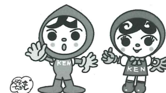
人KENまもる君 人KENあゆみちゃん