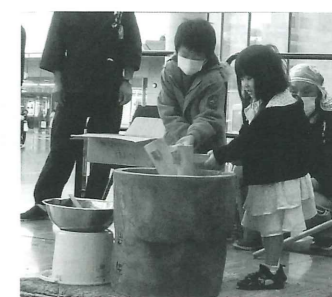
子ども餅つきパフォーマンスの様子