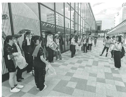
①福井の高校生などで構成される団体が、福井駅周辺や中央公園などの清掃を通して福井を活性化する活動を実施

②こどもが自分らしく笑顔で暮らせるように、多様な学びのイベントを通して地域の「居場所」をつくる取り組みを実施