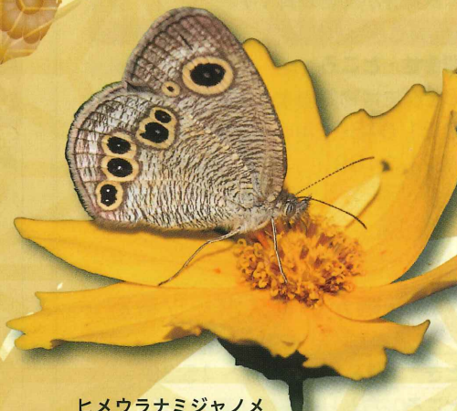
ヒメウラナミジャノメ

令和7年の平支である巳（へび）にちなみ、へびの剥製や標本を展示し、その生態について解説します。また、へびにまつわる伝承や、へびにちなんだ名前を持つ動植物なども紹介します。