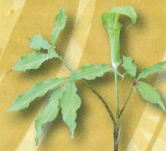
マムシグサの仲間