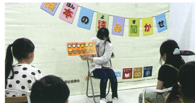
▲ショッピングシティ・ベルで行ったイベントの様子