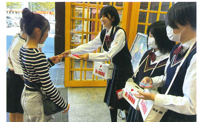
▲ラブリートパートナーエルパでの街頭募金の様子