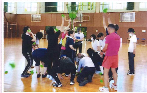
▲福井市身体障がい者スポーツ大会の様子