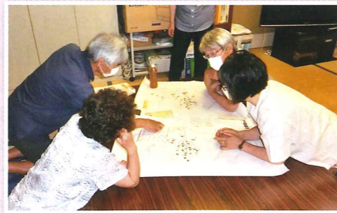
▲地域支え合いマップづくりの様子