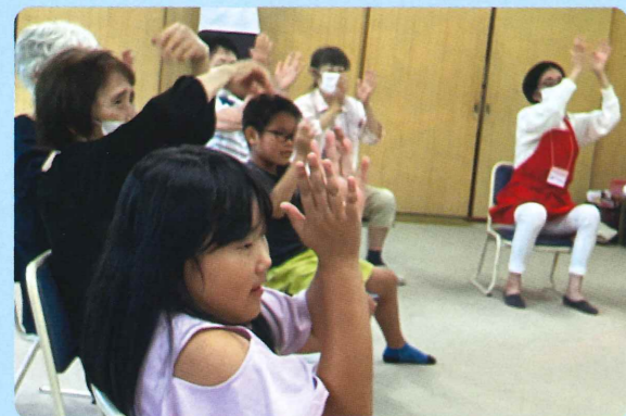
▲アイ・サンサンでの交流の様子