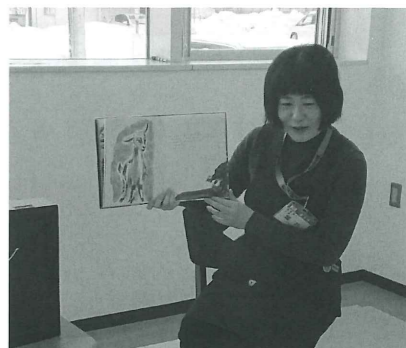
読み聞かせの様子