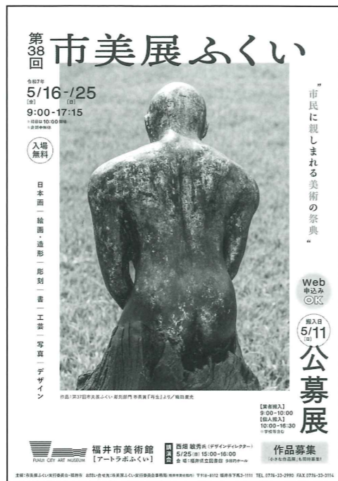
市美展ふくい ポスター

日本画部門 ・10号以上100号以下の額装(色紙は除く) ・50号以上は5cm以内の仮縁