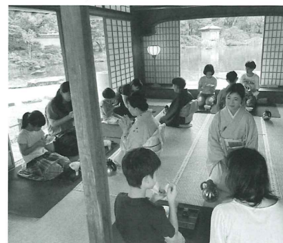
昨年開催時の様子