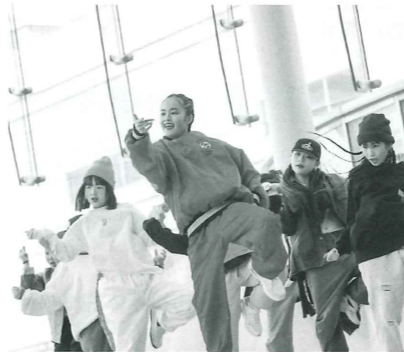
昨年のダンスフェスの様子