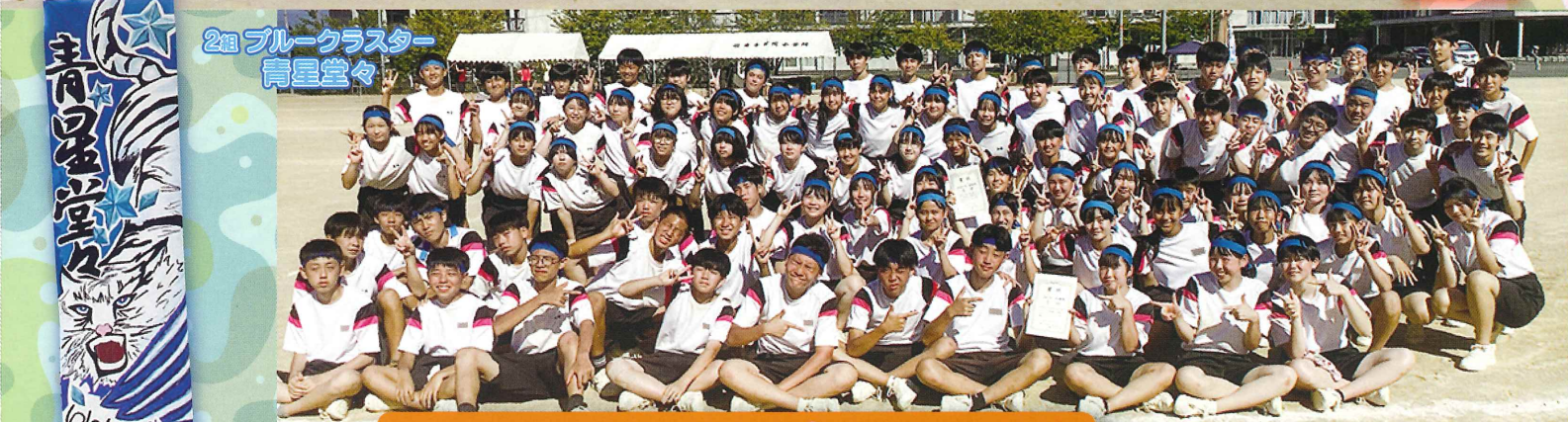
2組 ブルークラスター 青星堂々