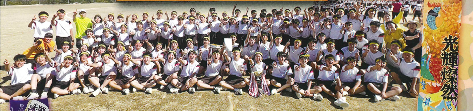
3組 イエロークラスター 光輝燦然