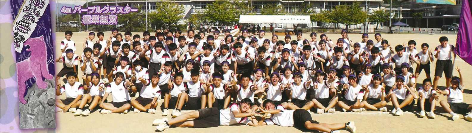
4組 パープルクラスター 極紫無双