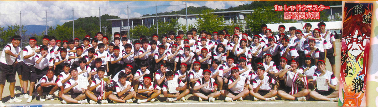
1組 レッドクラスター 勝破笑火戦