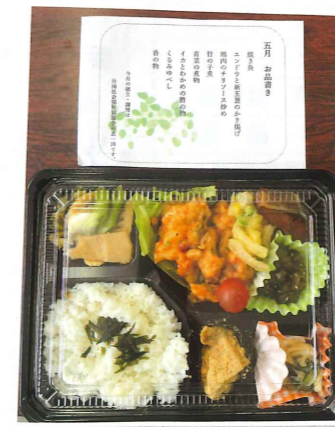
おしながき付 お弁当