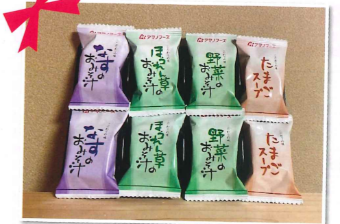
夏季・歳末訪問品