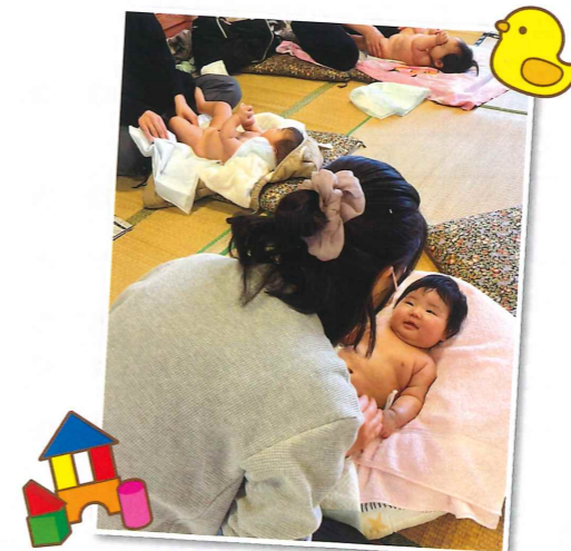
ベビーマッサージと育児相談