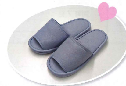
すべりにくいスリッパを 公民館に寄贈