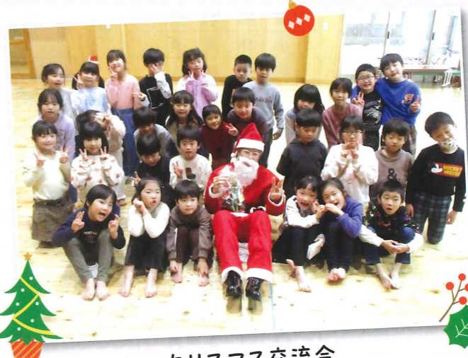
クリスマス交流会

2,521,908円(収入) - 2,008,747円(支出) = 513,161円→繰越