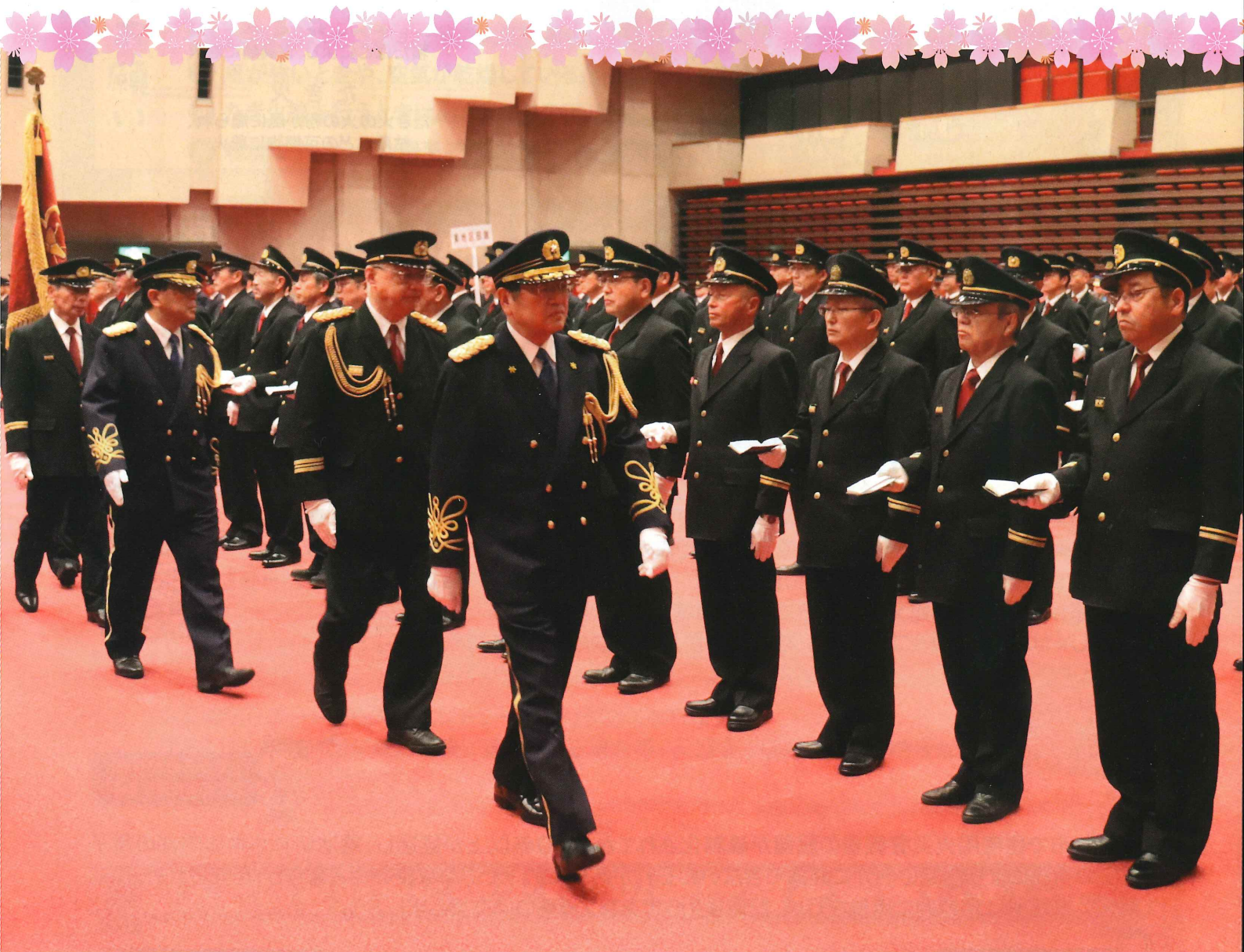
表紙写真:令和7年1月11日(土)に行われた、「令和7年福井市長消防年頭視閲」の様子です。