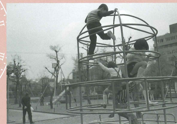
遊具で遊ぶ子どもたち(昭和49年)

どが設置され、子どもたちに親しまれました。また、昭和34年には噴水が寄付され、池中央に据えられた聖火台型の水盤から勢いよく噴き出す水柱が市民の目を喜ばせました。