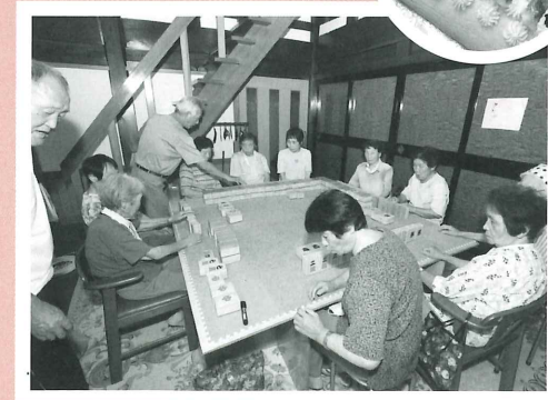
いろいろな地区から参加する高齢者たちは「コミュニケーション麻雀」を通じて、近所付き合いを越えたコミュニケーションを楽しむ