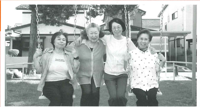
グループの主要メンバー。百歳体操を通じて出会い、現在では新しい地域活動を企画している。仲の良さはピカイチ

百歳体操のような地域の高齢者が集う場に参加することには、良い運動になるというだけでなく、さまざまなメリットがあるといいます。「参加者との何気ない会話を通じて地域の困りごとや問題点を発見したり、地区の先輩に歴史や文化を学んだり、週に 1 回集まって話す機会をつくることで地域全体が活気付く。毎回参加する決まった人たちだけでなく、年代や性別問わず幅広く参加してほしい」と話します。「最近では、参加者皆でお茶を楽しんだり、語り合ったりする時間を積極的に設け、体操 + α の活動を心がけている。地域と関わりを持たない高齢者の人たちでも、自然と参加したくなる仕掛けをつくっていききたい」と熱く話してくれました。