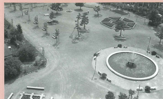
昭和43年の中央公園

福井市中央公園は、戦災復興都市計画により昭和29年に現在の場所(大手3丁目)に開設されました。昭和31年には、公園内に遊具や水遊び用の池などの遊戯施設をはじめ、児童用図書を備えた児童館な