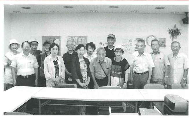
人が集いやすい福井駅周辺を活動の拠点としているため、地域を超えた幅広いつながりができ、参加者たちの生きがいに繋がっている