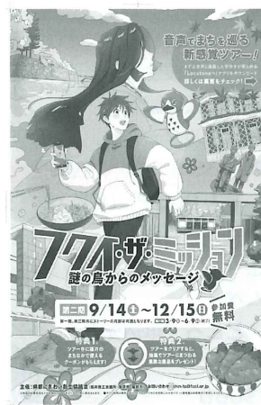
フクイ・ザ・ミッションチラシ