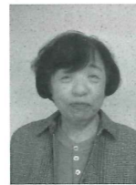
優良施設 タカラ美容室 美容業