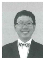
優良施設 つくも橋ピリケン 飲食店営業