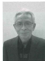
優良施設 ヨーロッパ軒 大和田分店 飲食店営業