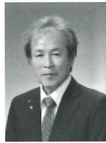
優良施設 スバル食品 そうざい製造業