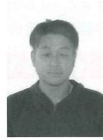
優良施設 おくとに理容所 理容業