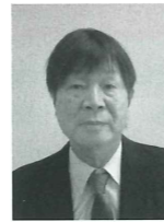
優良施設 hair salon kaoru 理容業