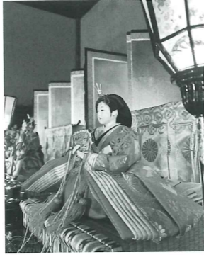
昨年のおさごえ民家園の様子

とき 2/4(火)～3/4(木) 9:00～17:15 ところ おさごえ民家園 内容 古民家にひな人形を飾ります。 入園料 110円 休園日 月曜日、祝日の翌日 問合せ 文化財保護課 TEL 35-1015 FAX 35-1017